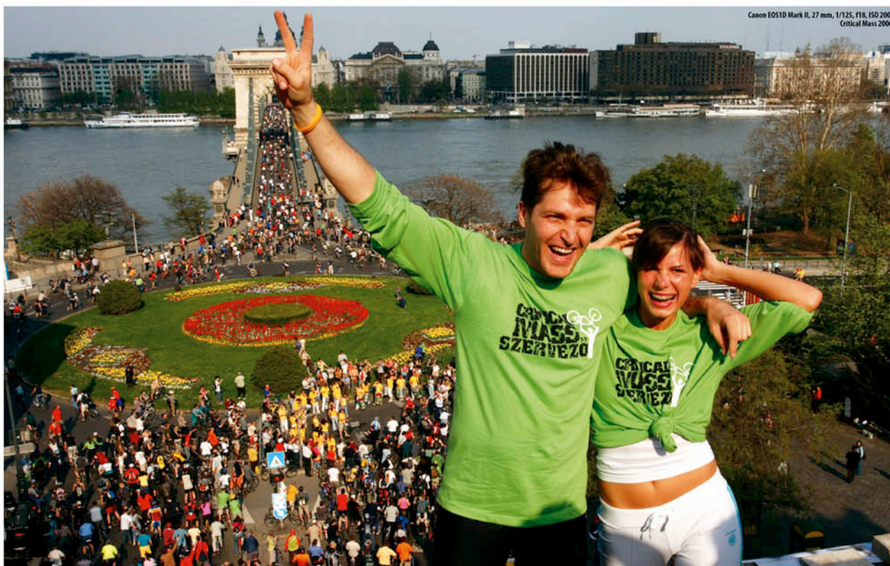
Canon EOS1D Mark II, 27 mm, 1/125, f18, ISO 200; Critical Mass 2006