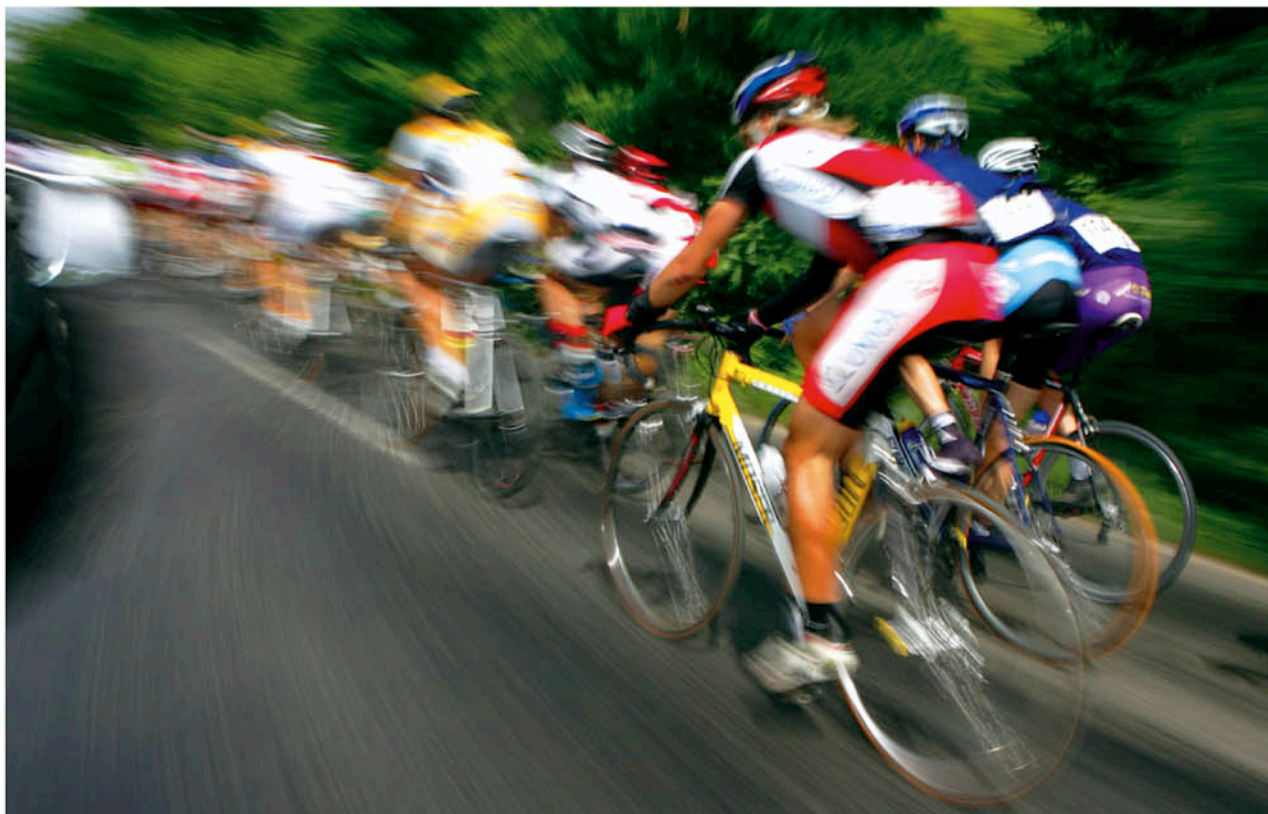
Canon EOS 1D Mark II, 24 mm, 1/20, f20, ISO 50; TóH 2005 – Szécsény. Az utolsó napon Dunakeszi felé.

A kerékpársportból tulajdonképpen igen, de más sportágak azért megmaradtak. Most már csak meghívásra megyek sportot fotózni. Idén voltam a Duna Maratonon, felkérték célfotózáásra. Ezt a műfajt nem tartom szerencsés dolognak, hiszen egy kerékpáros maraton nem olyan, mint az evezés, ahol az utolsó lapátűzők az a legizgalmasabbak. Szívem szerint valahol a pályán készítettem volna kemény akciófotókat, de a szervezők a célfotót igényelték. Ez egy nagyon kemény egész napos robot. Lefényképezted a rajtot, majd egy órával később kezdődik az örület, jönnek az első célba érkezők. Mindenkiről kell kép, így aztán este fél nyolcig nem moz-