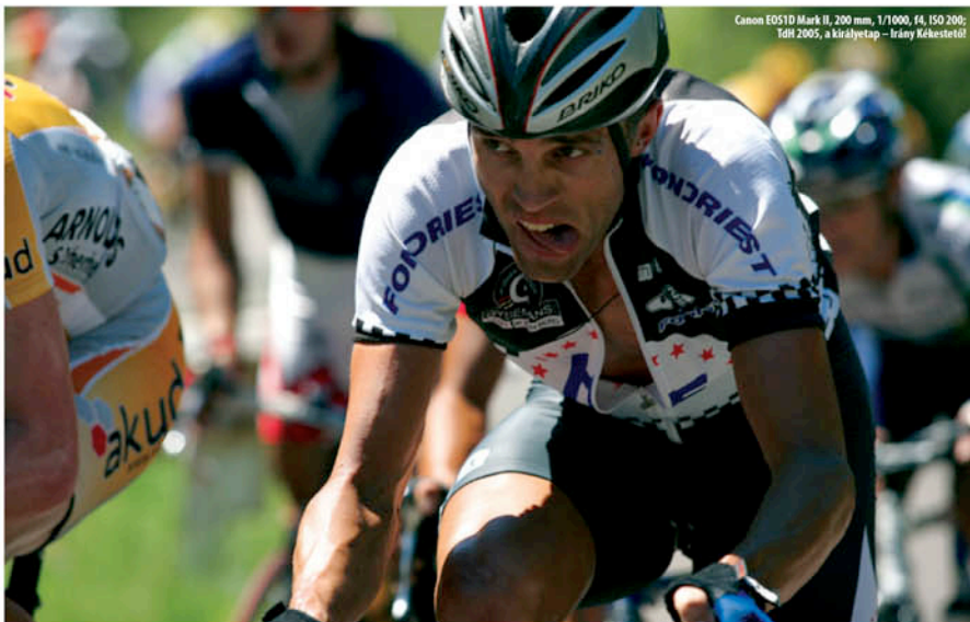
Canon EOS1D Mark II, 200 mm, 1/1000, f4, ISO 200; TdI 2005, a királytáp – Irány Kékestető!